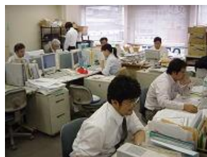
知的財産部 調査グループ