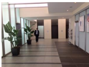
虎ノ門 第 30 森ビル